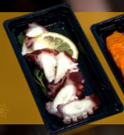
Octopus € 3,95