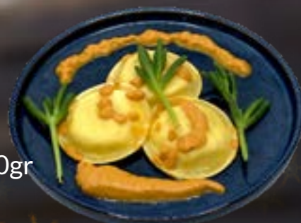
Ravioli (coquille) met vanille saus € 12,95 6 stuks ca. 350gr