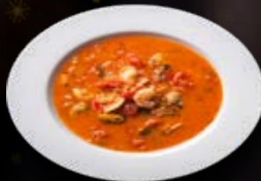
Bouillabaisse € 4,95/0,5 liter