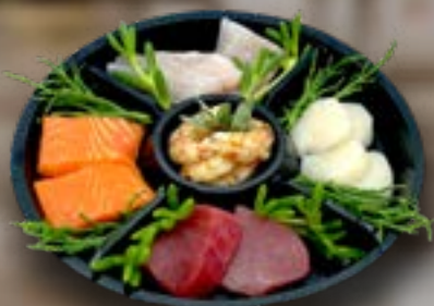
Gourmetschotel (ca 250gr p.p.) € 12,95