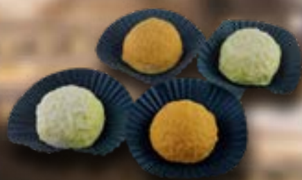
Vis bonbons € 1,95 /stuk