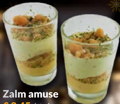
Zalm amuse € 3,45 /stuk

Lekkere hapjes voor bij de borrel! Niet alleen een goed stuk zalm of een salade op toastjes, maar ook sashimi en visbonbons met verschillende vullingen.