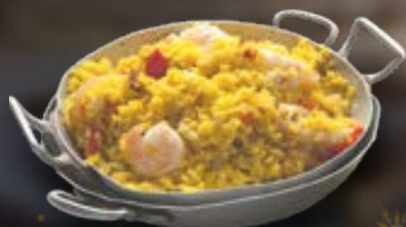
Paella (kant en klaar) € 2,25 /100gr