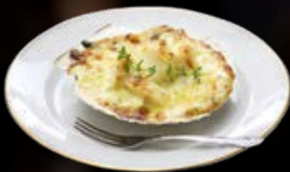
Coquille schelp gratin € 5,95/stuk